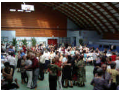
Instantánea de la celebración en Burdeos