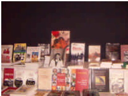
Muestra de la exposición

Durante este primer semestre se han realizado actividades culturales en diversas regiones, que han tenido mucho eco. Los temas que más interés han despertado han sido los relativos a la Memoria de los Españoles en Francia. Así, tanto en Angulema, como en Burdeos, se han movilizado más de quinientas personas. Y lo que es más significativo un gran número de escolares. Los que estéis interesados por hacer algo en este sentido, sabed que disponemos de una exposición sobre el tema, y la posibilidad de conseguir más de otras instituciones. Aprovechamos para agradecer a la asociación FFREEE de Argelès sur Mer por habernos cedido en varias ocasiones su exposición "La Retirada".